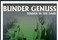
Dinner in the Dark