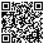
Ergebnisse live verfolgen

Bambini Cup für F1/F3 Jahrgang 2010 Am Donnerstag 30.05.2019 bei TSV Kareth Lappersdorf